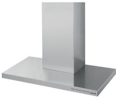
Campana extractora KS Lux